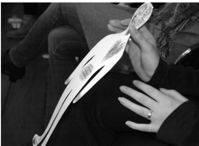
Abb. 1: Stärken – Schwächen.