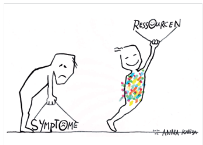
Abb. 2: In sich selbst nach Schätzen suchen.

Im Dialog wird lebendiges, existentielles Zuhören ermöglicht, über gelungene und gescheiterte Versuche, Scham und Schuldgefühle, Glücksmomente und Ganzheit. Die Kernfähigkeit »Sprich von Herzen« erweist sich als ausgesprochen alltagstauglich. Wir haben sie noch erweitert: »Mit dem Herzen hören.« Wenn Menschen sich wahrgenommen und gewürdigt fühlen so wie sie sind, kann ein Vertrauensraum entstehen, damit die Energie ins Fließen kommt und Blockaden aufgelöst werden. Ihre Einzigartigkeit ist Teil der Persönlichkeit und das Ergebnis ihrer bisherigen Lebenserfahrung.