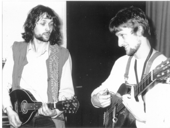
November 1979 im Fritz-Henßler-Haus, Dortmund