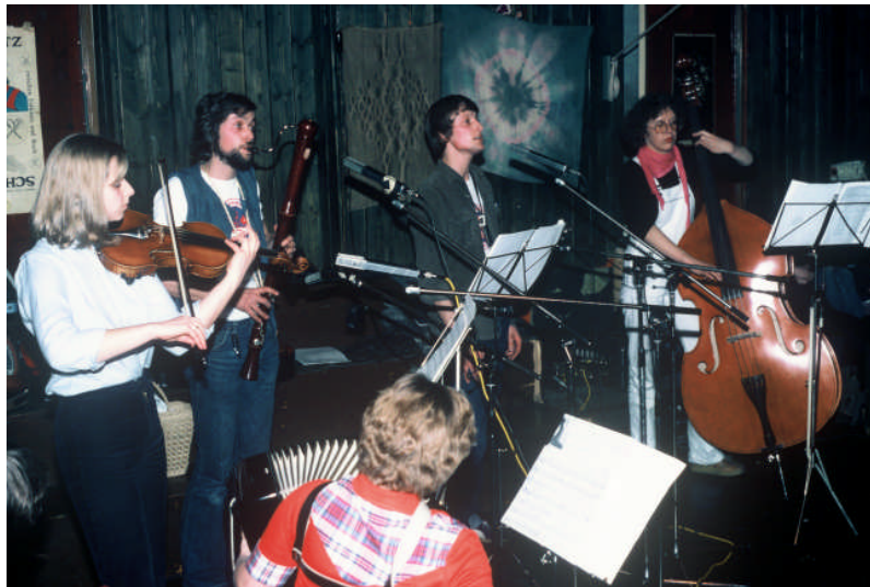
Premiere 1980. Fritz-Henßler-Haus, Dortmund.