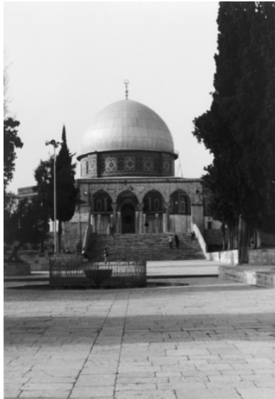
In Jerusalem 1981: Tempelberg

schwiegen einfach oder summten leise die Lieder mit, wurden erinnert und waren im Dunkel des Saales zu Tränen gerührt. Danach setzten wir das Konzert bei voller Saalbeleuchtung fort. Es wurde ein unvergesslicher